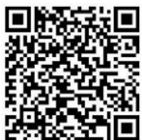
Javier Oliva Projektleiter

Weitere Informationen zum Projekt Dreispitzknoten finden Sie auf der Webseite des Tiefbauamts www.tiefbauamt.bs.ch/dreispitzknoten